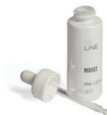
MELINE® 03 Moist