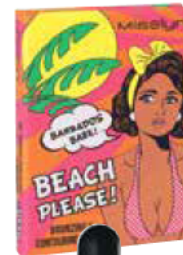
MISSLYN „BEACH PLEASE! Bronzing & Contouring Powder“, ca. 6 Euro

er Trick, dem die Stars vertrauen: Zuerst wird Selbstbräuner für einen tollen Glow verwendet. Bronze zwischen den Brüsten sorgt sofort für eine prallere Optik. Highlighter am Schlüsselbein schafft einen tollen Hingucker-Effekt.