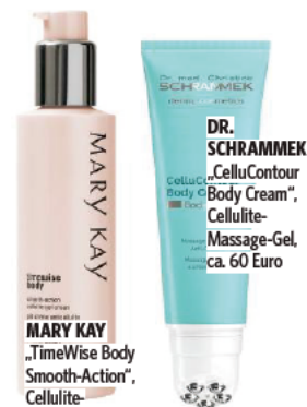
MARY KAY „TimeWise Body Smooth-Action“, Cellulite-Gelcreme, über marykay.de , ca. 39 Euro

Der Experte weiß: „Cellulite kommt von zu viel Fett unter schwachem Bindegewebe – so entstehen Verformungen.“ Die Lösung: eine Fettabsaugung. Was wird gemacht? Eine betäubende Lösung wird in das Unterhautfettgewebe gespritzt und verteilt. Danach wird das Gemisch aus Lösung und Eigenfett mit einer Vakuumpumpe abgesaugt. Erholungszeit: Die Behandlung ist ambulant mit lokaler Betäubung. Ca. drei Wochen muss ein Stütz-mieder getragen werden. Für wen? Alle, die ihre Reiterhosen mit Sport und Diät nicht loswerden. Kosten: ca. 2.400 Euro. Das kann die Creme: Das Geheimnis sind durchblutungsfördernde Wirkstoffe, denn sie straffen. Dazu gehören etwa pflanzliches Ginkgo, Anti-Aging-Wunder Biotin sowie Koffein. Und: Manche Cremes kommen mit Massage-Kopf, verbessern die Wirkstoff-Aufnahme der Haut.