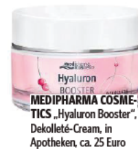
MEDIPHARMA COSMETICS „Hyaluron Booster“, Dekolleté-Cream, in Apotheken, ca. 25 Euro

„Meine Brustvergrößerung mit 18 war die beste Entscheidung, die ich je getroffen habe. Dank meiner Implantate bin ich viel selbstbewusster geworden!“