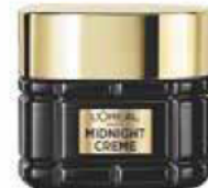
JUNGBRUNNEN »Age Perfect Zell-Renaissance Midnight Cream«, mit Vitamin E, von L'Oréal Paris, 50 ml, ca. 20 Euro