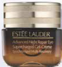
SCHATTENFREI »Advanced Night Repair Eye Supercharged Gel-Creme«, mit antioxidativem Vitamin E, von Estée Lauder, 15 ml, ca. 73 Euro