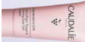
STRAFFTAT »Resveratrol-Lift Lifting Augenpflege«, mit Resveratrol und Hyaluronsäure, von Caudalie, 15 ml, ca. 39 Euro